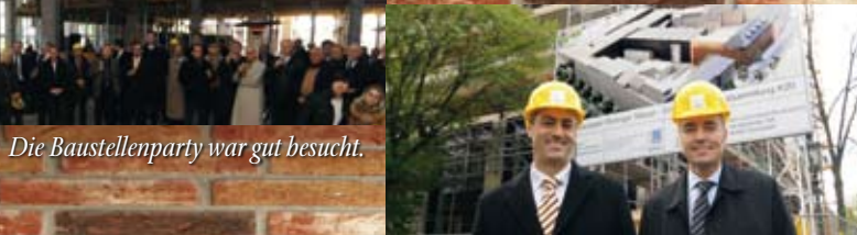
Die Baustellenparty war gut besucht.