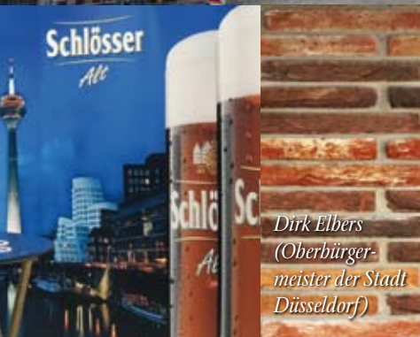
Dirk Elbers (Oberbürgermeister der Stadt Düsseldorf)